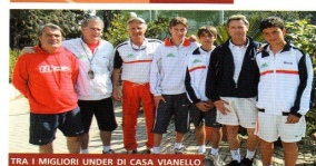
TRA I MIGLIORI UNDER DI CASA VIANELLO